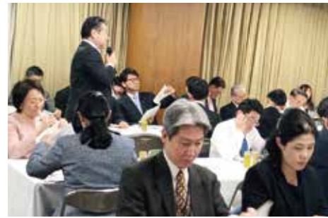
社会保障制度に関する特命委員会

「平成30年度 診療報酬・介護報酬改正」では、石田まさひろ参議院議員は厚生労働委員会の筆頭理事として、私たちの声を反映すべく取り組まれてきました。