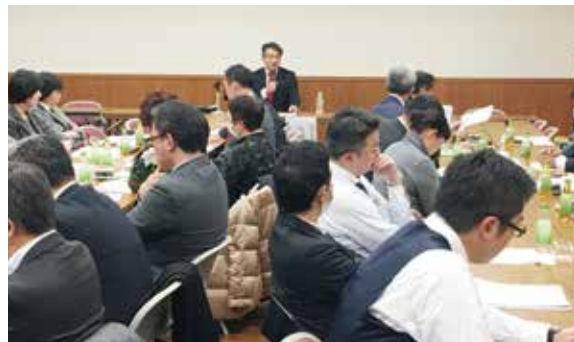
診療報酬・介護報酬研究会