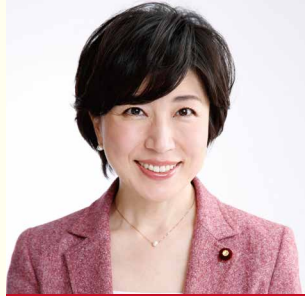
木村やよい 衆議院議員