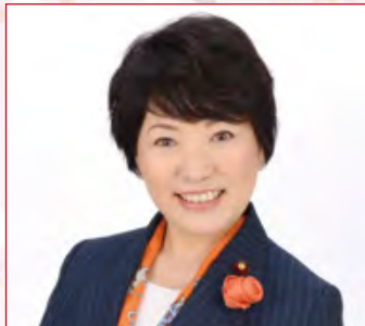
衆議院議員 あべ俊子

1月に松江市で開催された県連総務会で副会長就任の挨拶をさせていただきました。党籍も出身地の宮城県から島根県へと異動し、新たに事務所を開設しました。皆さまのご期待に応えられるよう精進してまいります。