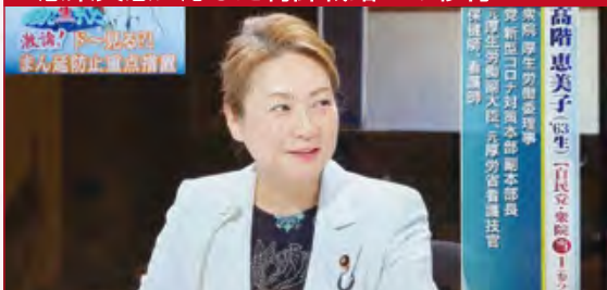
衆議院議員 たかがい恵美子