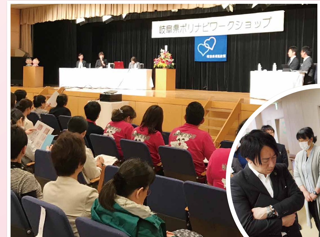
第8回「岐阜県ポリナビワークショップ」

2017年10月1日 発行所/岐阜県看護連盟 編集者/伊佐治 哲也 〒500-8367 岐阜市宇佐南4丁目7番 1階東アミューズBR TEL058-268-7340 FAX058-268-7345 E-mail: kangorenmeigifuken@cronos.ocn.ne.jp URL http://www.gkr.jp/