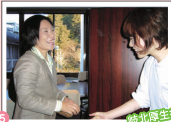
5 岐北厚生病院 挨拶 ミニ集会