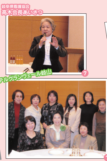
岐阜県看護協会 高木会長あいさつ