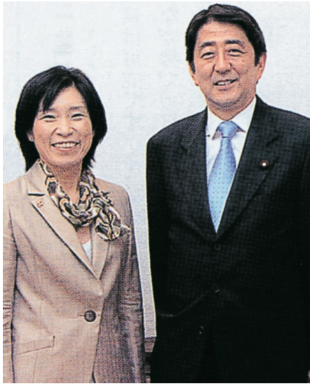
日本看護連盟機関誌「アンフィニ」で、看護職、働く女性、日本社会の将来について、当時、官房長官だった阿部晋三総理と対談。

私は、昨年5月日本看護協会総会で推薦されて以来、国政をめざし政治活動を行って参りました。この間、第一線で活躍している35,000人以上の看護職の方々と会い、話を聞き、語り合っ参りました。