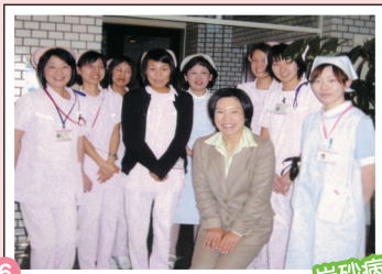
6 岩砂病院 挨拶 ミニ講演