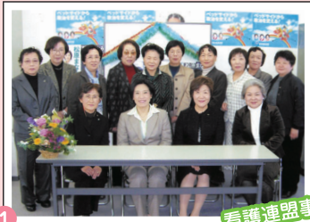
1 看護連盟事務局 ミニ集会