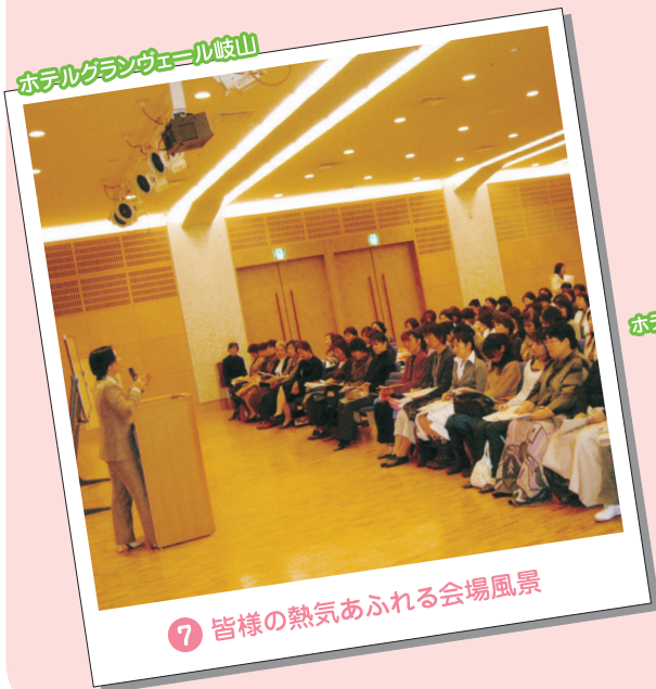
7 皆様の熱気あふれる会場風景