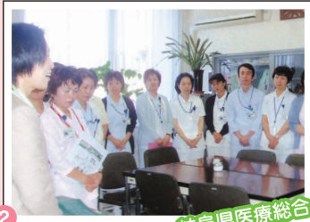
2 岐阜県医療総合センター 挨拶