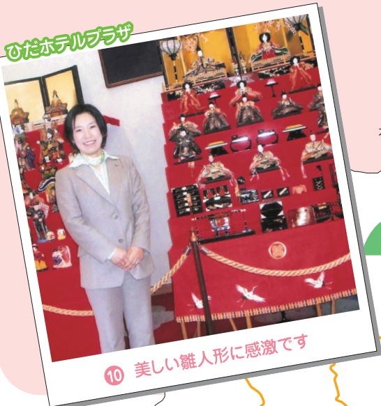
10 美しい雛人形に感激です