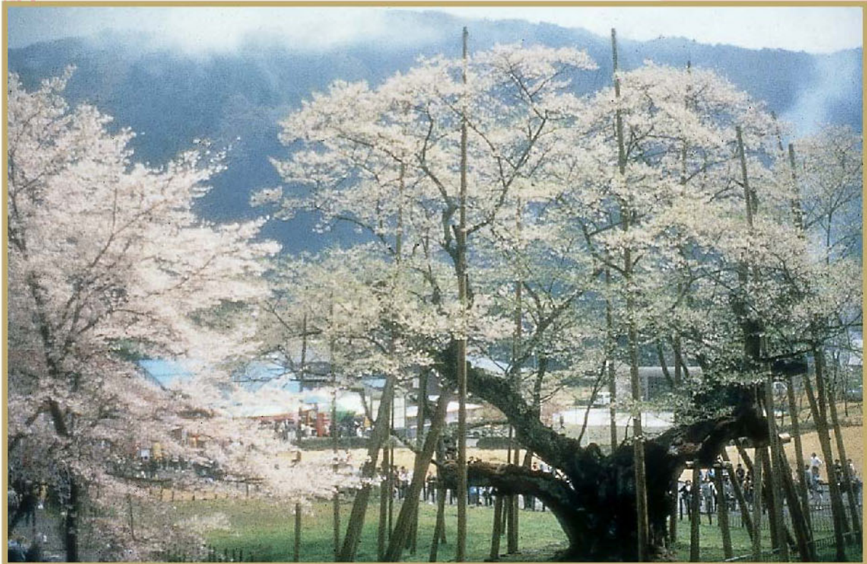
本巣市:根尾谷淡墨桜