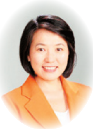
衆議院議員 あべ俊子先生

活動する看護職の一人として、これからもみなさまとともに、真摯な取り組みを続けて参る所存でおりますので、引き続き、よろしくご指導くださいますようお願いいたします。