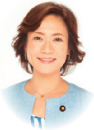
参議院議員 高階恵美子先生