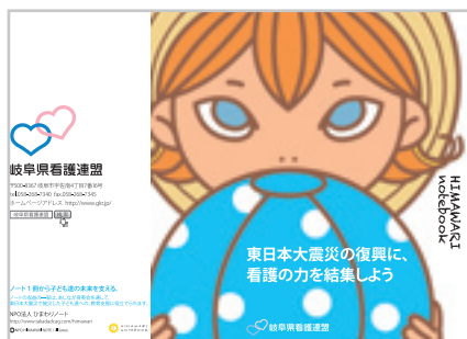
ひまわりノート1冊100円