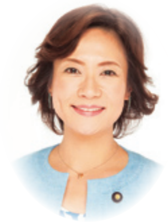
参議院議員 高階恵美子先生

岐阜県看護連盟の皆様、いつも温かいご支援を賜り心より感謝申し上げます。 第180回国会が開催され、早2か月がたちました。審議の遅れから今年度予算は年度内に成立せず、14年ぶりに暫定予算が組まれることとなりました。 私個人は、連日国会で質問の機会をいただくとともに、多くの政策提言の実現に奔走しております。現在取り組んでいるテーマは、医療における患者の意思決定のための法整備(尊厳死法案)、女性が仕事と家庭を両立するための施策(学童保育の法的整備)、など多岐にわたっています。いずれも私が議員となってから長年取り組んできた課題です。今国会では多くの法案審議が予定されており、実現にはまだ道半ばですが「継続は必ず実を結ぶ」ことを信じ、取り組んでまいります。 さて、次期参議院選挙に向けよいよ始動です。皆様のお力により前回参議院選挙で高階恵美子さんが当選し、この3年間「二本の矢」でがんばってまいりました。これが「三本の矢」となれば、もっと折れにくく、大きな力となります。候補予定者の石田まさひろさんに私たちの夢を託し、がんばってまいりましょう。