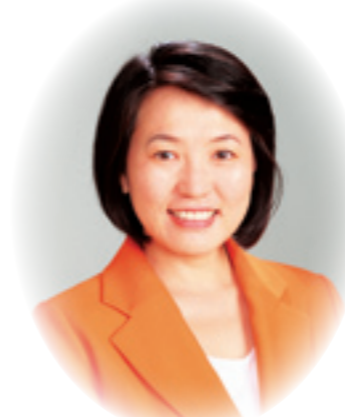
衆議院議員 あべ俊子先生

岐阜県看護連盟の皆様、いつも温かいご支援を賜り心より感謝申し上げます。 第180回国会が開催され、早2か月がたちました。審議の遅れから今年度予算は年度内に成立せず、14年ぶりに暫定予算が組まれることとなりました。 私個人は、連日国会で質問の機会をいただくとともに、多くの政策提言の実現に奔走しております。現在取り組んでいるテーマは、医療における患者の意思決定のための法整備(尊厳死法案)、女性が仕事と家庭を両立するための施策(学童保育の法的整備)、など多岐にわたっています。いずれも私が議員となってから長年取り組んできた課題です。今国会では多くの法案審議が予定されており、実現にはまだ道半ばですが「継続は必ず実を結ぶ」ことを信じ、取り組んでまいります。 さて、次期参議院選挙に向けよいよ始動です。皆様のお力により前回参議院選挙で高階恵美子さんが当選し、この3年間「二本の矢」でがんばってまいりました。これが「三本の矢」となれば、もっと折れにくく、大きな力となります。候補予定者の石田まさひろさんに私たちの夢を託し、がんばってまいりましょう。