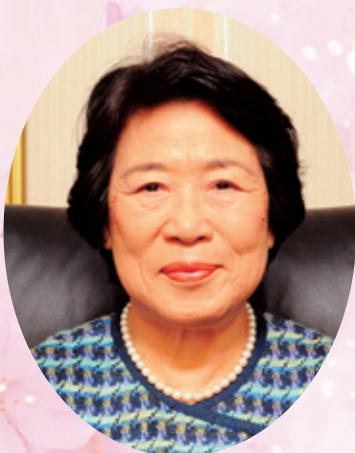
日本看護連盟 会長 清水嘉与子