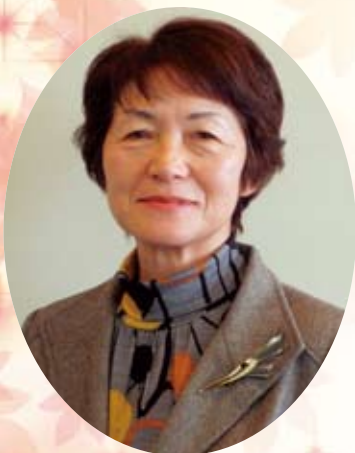
公益社団法人 岐阜県看護協会

気力と情熱だけは、誰にも負けないつもりでおりますので、どうぞよろしくお願い いたします。