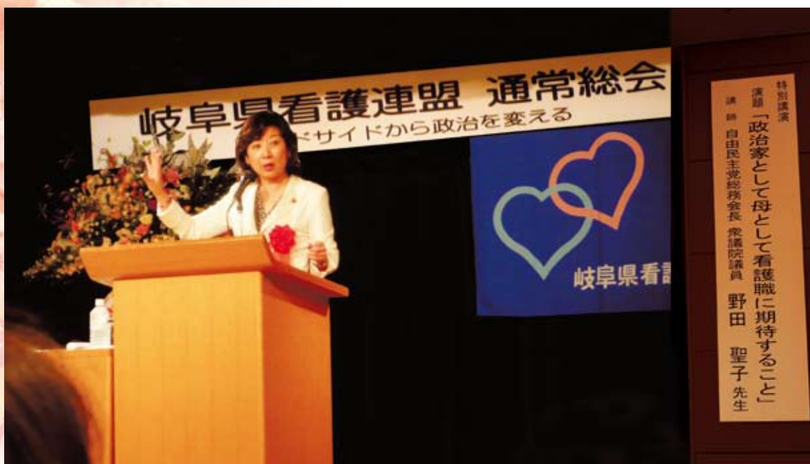
総会后、特別講演をいただきました。